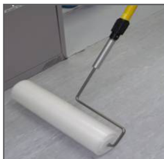
Липкий ролик для уборки полов