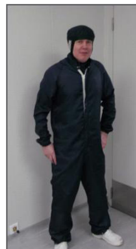
Одежда, предназначенная для работы в чистых помещениях Класса 10000.

Подача чистого воздуха, тем не менее, это только часть процесса. Наибольший источник загрязнений – это человек. Тело человека, просто при обычном перемещении по комнате, может генерировать от 5 до 10 миллионов частичек кожи, волос, грязи, частичек одежды каждую минуту и в 10 раз меньше, если человек сидит или стоит. По этой причине очень важно свести к минимуму передвижение персонала в чистых помещениях.