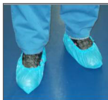
Второй шаг – бахилы, надеваемые на бытовую обувь, которую носят вне чистых помещений.