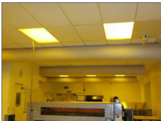
На фотографии показаны рукавные фильтры обеспечивающие диффузную подачу воздуха через HEPA-фильтр

Циркуляция чистого воздуха – сердце технологии чистых помещений и первый шаг в достижении чистоты с точки зрения качества воздуха. Воздух хорошо фильтруется с помощью высокоэффективных фильтров HEPA (High Efficiency Particulate Air), которые должны периодически промываться. HEPA-фильтр задерживает около 99.97% частиц размером более чем 0.3 мкм не допуская их попадание в чистое помещение.