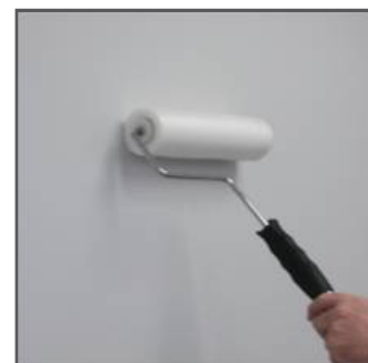
Липкий ролик для стен

Наличие статического электричества, возникающее вследствие трения или электромагнитной индукции, приводит к большему прилипанию пыли к поверхностям. Даже простое движение вытаскивания листа пленки из стопы приводит к возникновению статики из-за разделения листов пленки и трения между ними. Таким образом, в чистых помещениях возможно потребуется использование антистатических мер, таких как специальные шины, антистатические заземления и ионизация воздуха.