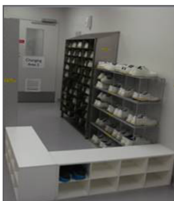
Раздевалку, где бытовую одежду меняют на спецодежду и обувь, можно выделить просто системой полок/скамеек с ячейками, как на фото. В ячейках хранится снятая уличная обувь (в бахилах). Чтобы попасть в раздевалку надо снять обувь и перешагнуть через скамейку.