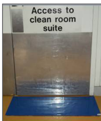
Липкий коврик при входе – первый этап снижения уровня загрязнений.

Спецодежда для чистых помещений изготавливается из синтетических тканей плотного переплетения, которые были разработаны для снижения загрязнений источником которых является человек. Каждый, кто имеет доступ в чистое помещение, должен надевать соответствующую спецодежду, которая включает так же головной убор, капюшон, бахилы и сменную обувь. Особое внимание следует уделить раздевалке, где обязательно следует разделить области, где размещается чистая и грязная одежда (наша обычная одежда, т.е. не предназначенная для работы в чистом помещении) и предусмотреть специальную процедуру переодевания, цель которой - предотвратить возможность попадания любых загрязнений. Спецодежда для чистых помещений должна регулярно стираться, как минимум еженедельно, следует также использовать специальную обувь.